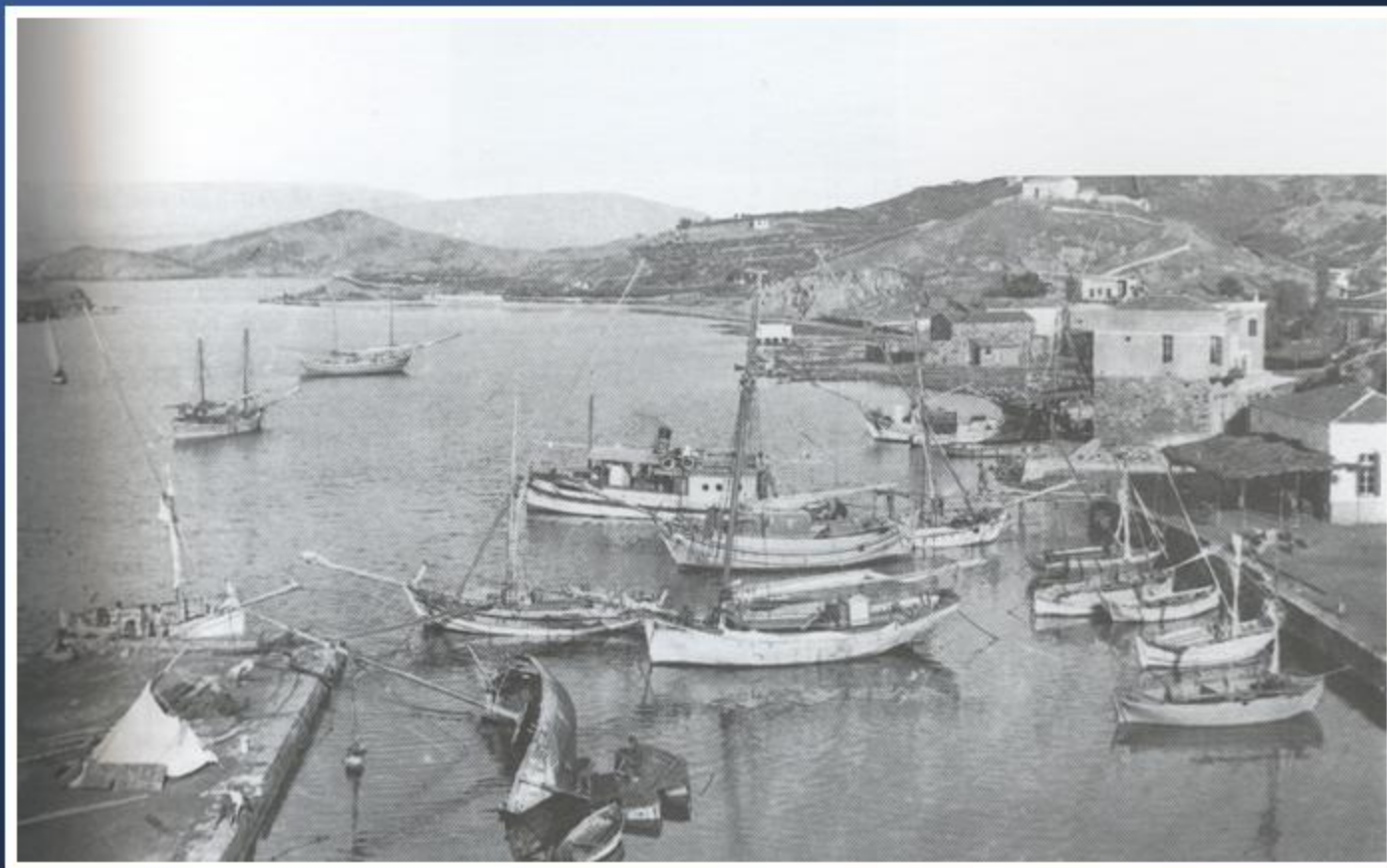
Καρενάρια στις Οινούσσες, 1920-1930.