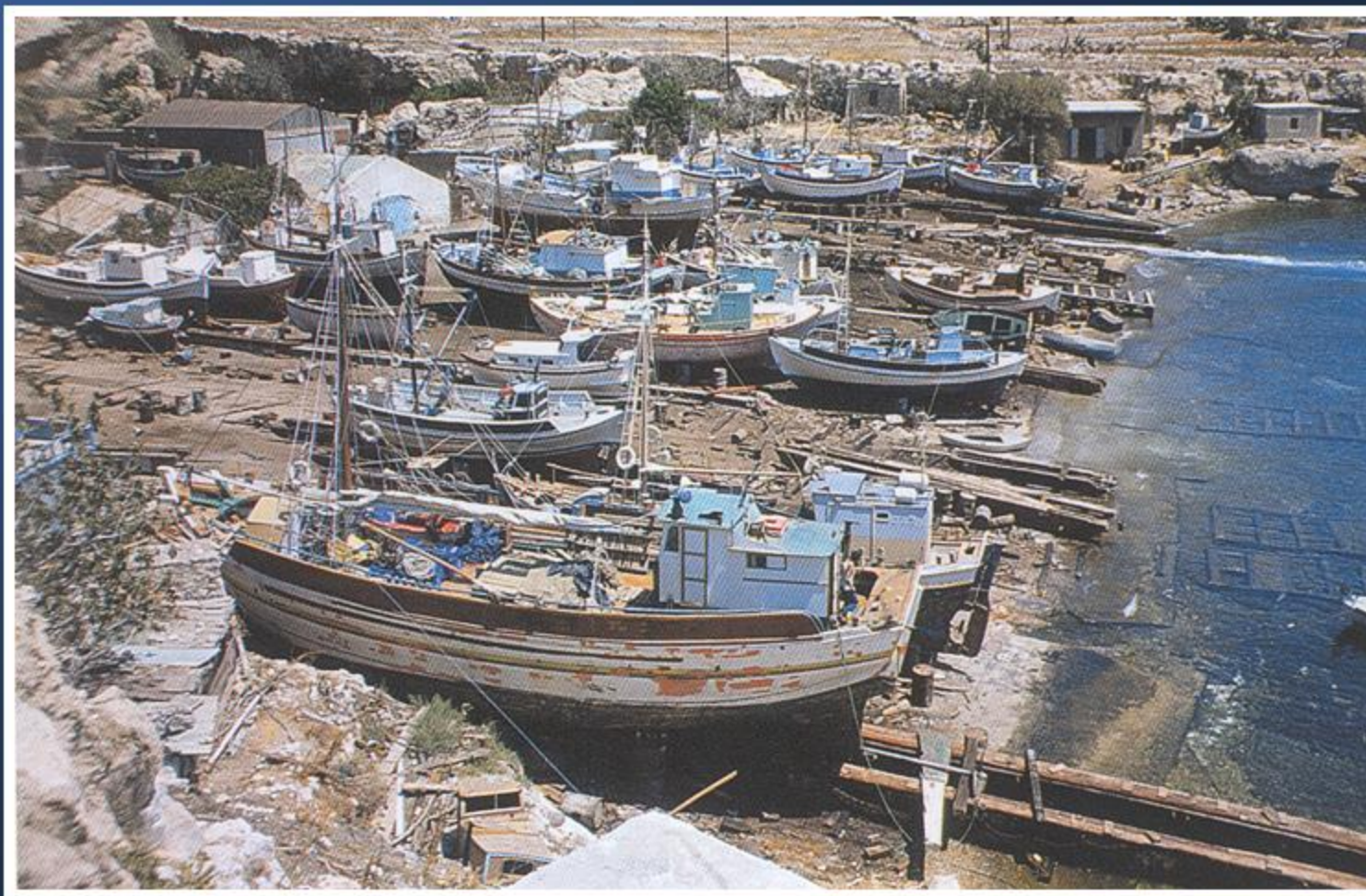
Ευλοναυπηγείο στο Λαφάσι της Καλύμνου, 1988