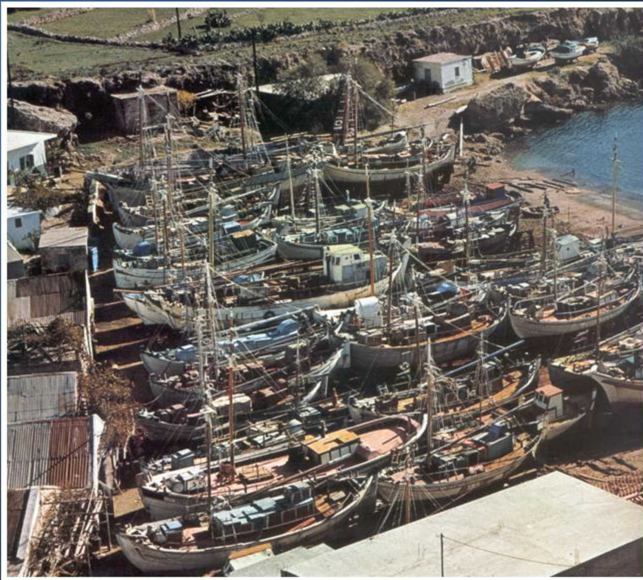
Κάλυμνος, Λαφάσι. Ο ταρσανός το 1970.