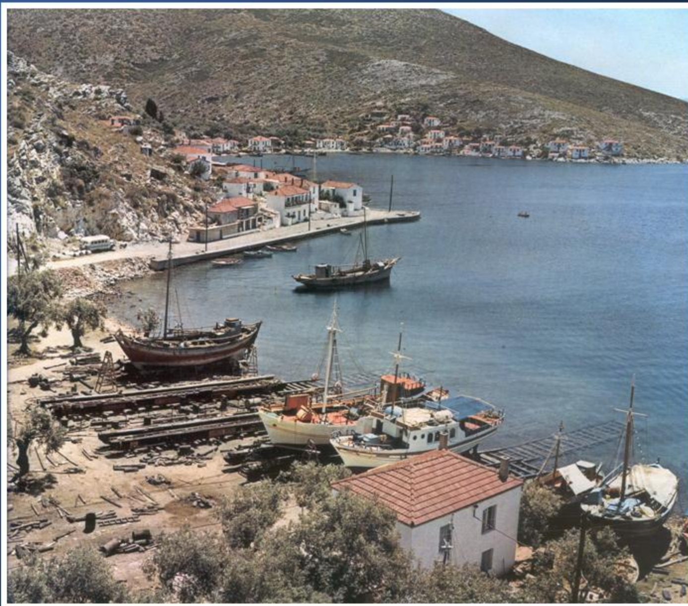
Τρίκερι. Ο ταρσανάς