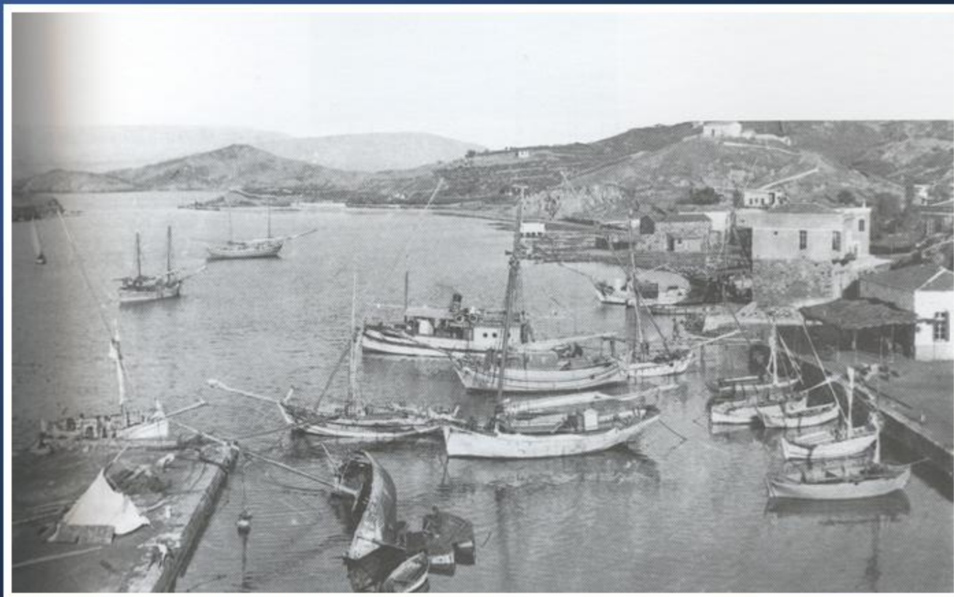
Καρενάρισμα στις Οινούσσες, 1920-1930.