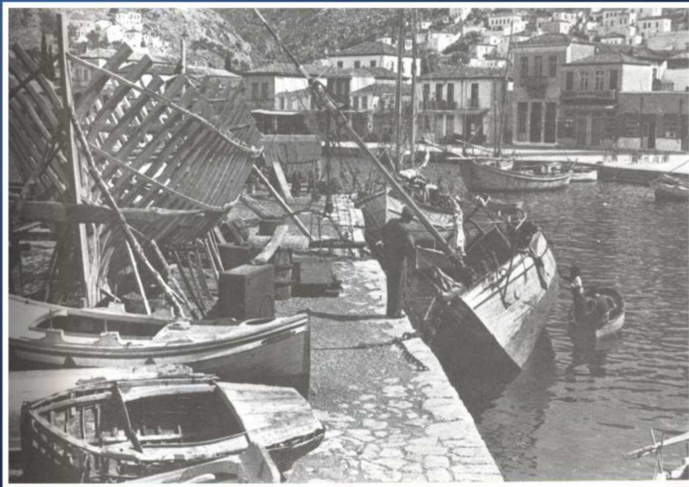
Καρενάρισμα στην Ύδρα. 1948