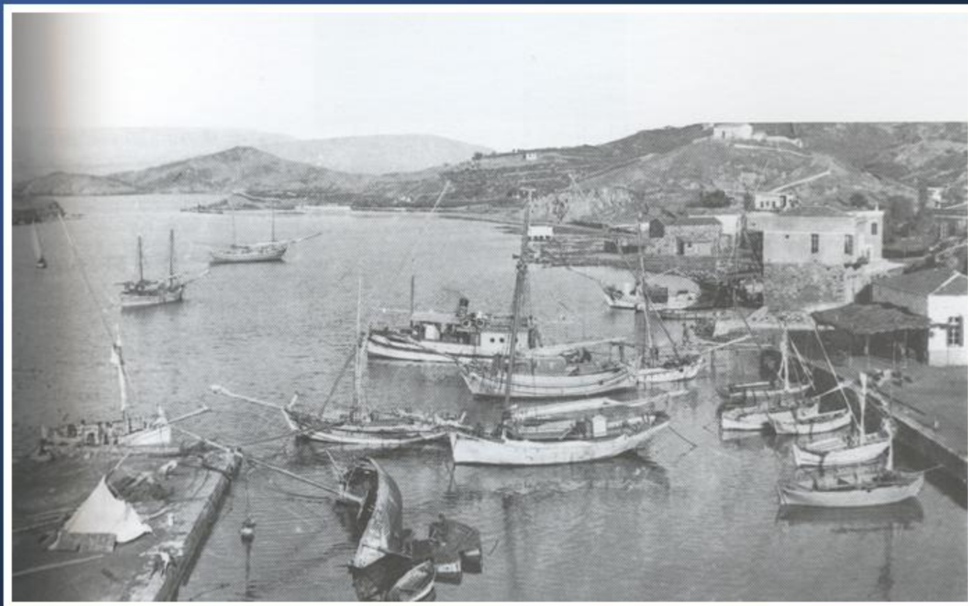
Καρενάρισμα στις Οινούσες, 1920-1930.